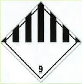
Abb. 1: Gefahrzettel Klasse 9

Immer wieder wird die Feuerwehr mit Gefahren, bei denen asbesthaltige Materialien freigesetzt werden, konfrontiert. Gemäß ADR/RID ist Asbest als Gefahrgut der Klasse 9 („Verschiedene gefährliche Stoffe und Gegenstände“) deklariert. In der Klasse 9 sind all diejenigen Gefahrgüter zu finden, die nicht eindeutig den Klassen 1–8 zugeordnet werden können.