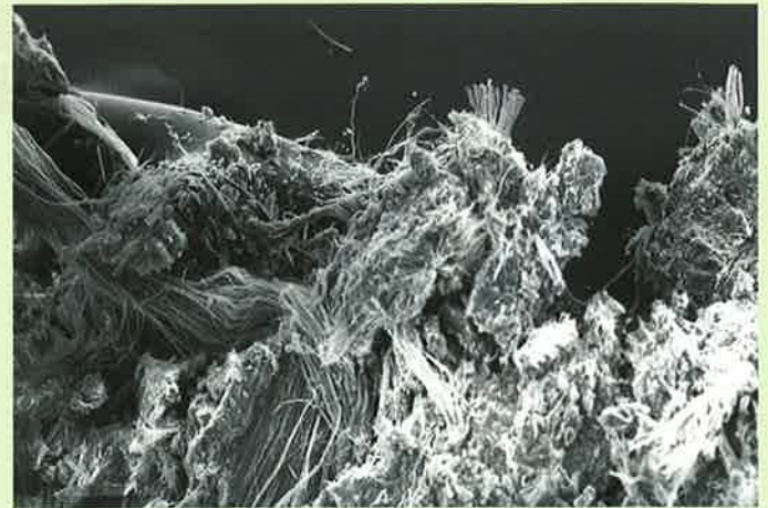
Abb. 4: Chrysotil, aufgenommen mit dem Rasterelektronenmikroskop