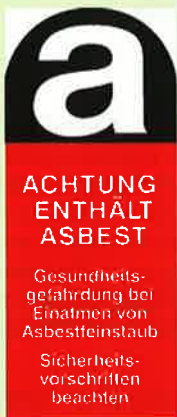
Abb. 3: Kennzeichnung von Asbest

Nach dem Einsatz erfolgt eine Reinigung von Fahrzeugen und Geräten. Ein besonderer Wert ist auf Hygienemaßnahmen der Einsatzkräfte (Duschen, Waschen) zu legen. Die Einsatzkleidung verbleibt im Feuerwehrhaus und wird mit einem entsprechenden Hinweis zur Wäscherei gebracht.